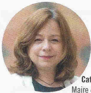
Catherine BARATTI-ELBAZ Maire du 12 e arrondissement